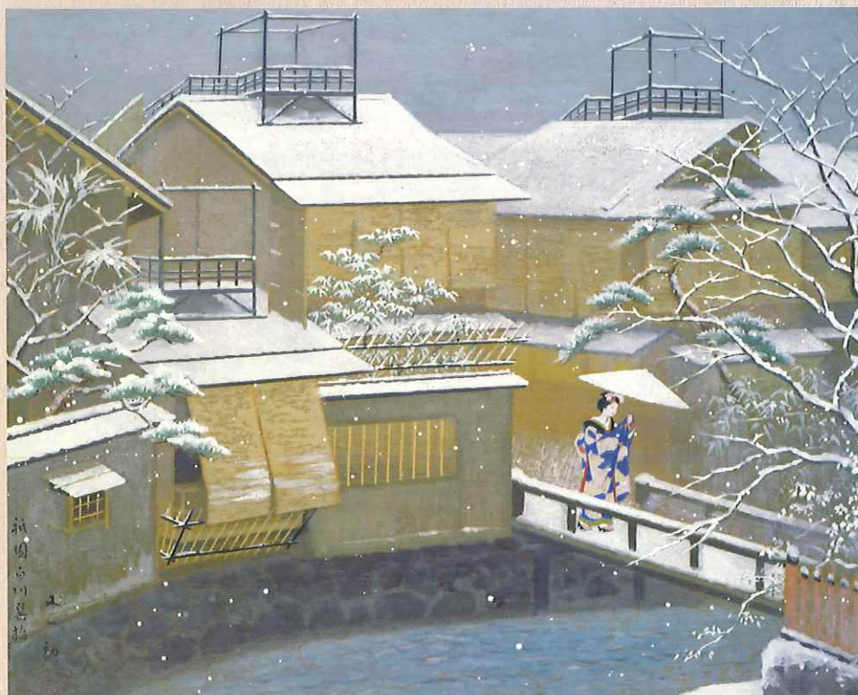
磯田又一郎「京の家並みと横丁」(京の百景6) 昭和48年 前期展示

Kyoto Institute, Library and Archives Grand Open Commemorative Exhibition