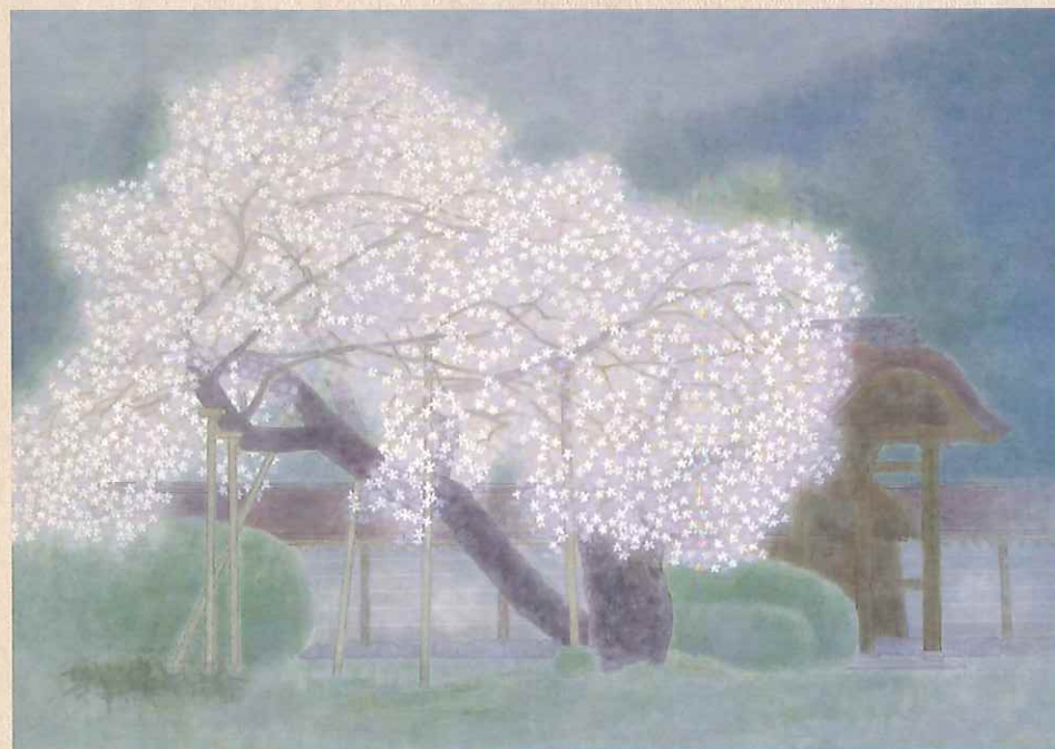
渡辺信喜「常照皇寺(御車返)」(京の四季246) 昭和61年 後期展示